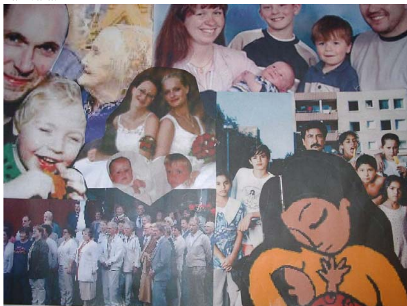
Bild 2. Kollage skapat av Lise-Lotte Gustafsson för att stimulera till samtal om vad en familj är och kan vara.

För temat familj, såg intervjuguiden ut som nedan. De tre första frågorna var obligatoriska och skulle diskuteras i alla grupper. Övriga frågor ställdes efter behov. Grupperna var utöver de tre obligatoriska frågorna fria att själva välja det som de tyckte av intressant och viktigt att diskutera. I en grupp, killar som läser gymnasieskolans medieprogram, räckte inte nedanstående frågor till utan där improviserades ytterligare frågor fram (se längre ner).